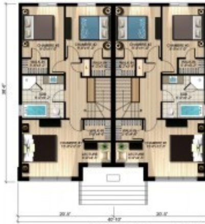
CONSTRUCTION ÉTAGE 688 pi 2 PHILIP COUSINEAU INC

Notes: Cette illustration est montrée à titre indicatif seulement, des différences peuvent survenir lors de la construction.